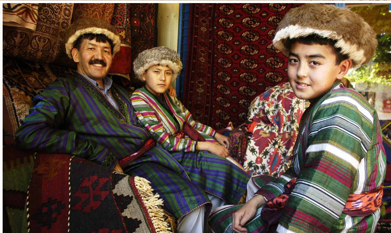
Rica em cultura, os habitantes locais desfrutaram de uma tarde em Herat, no Afeganistão

mil soldados e civis britânicos que fugiram de Cabul morreriam de frio, fome - e uma emboscada das forças afegãs que reduziram o bando em retirada a um único sobrevivente. Muitos acreditam que o sobrevivente teve permissão para viver apenas para poder contar a história e avisar as futuras potências para não mexerem com o Afeganistão.