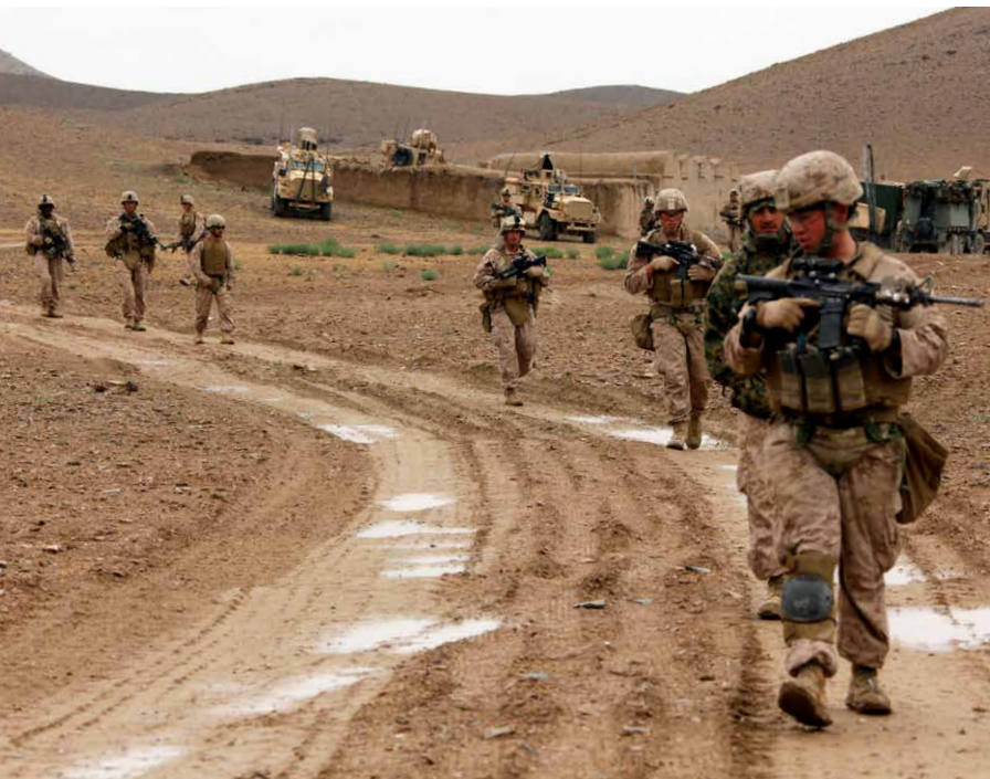
Patrulha dos fuzileiros navais dos EUA como parte da Operação Liberdade Duradoura, em Kajaki, Afeganistão

A realidade é que não importa o que as pessoas pensem, há muçulmanos que simplesmente nasceram em uma família muçulmana (e, portanto, são oficialmente muçulmanos), mas que não querem nada mais do que viver uma vida normal. Mas, também existem vertentes do Islã que exigem a submissão total ao Alcorão e a destruição de todos os que se recusam. Na verdade, a palavra Islã significa submissão. Mas a polícia politicamente correta não queria saber disso. Ela insistia que o Islã era uma religião pacífica. Quando o presidente Bush enviou tropas ao Afeganistão, a guerra estava definida. Não foi uma guerra contra o Islã radical, foi uma guerra contra o terrorismo.