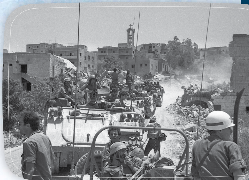
FDIs avançam perto de Beirute na tentativa de derrotar o domínio da OLP no Líbano

Guarda no feriado, não há muita atividade na base. A essa altura, as notícias sobre minha fé no Messias