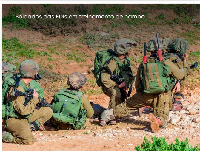
Soldados das FDI em treinamento de campo

Ironicamente, só vim a conhecer uma vida diferente quando fui punido por ter saído da unidade sem uma licença oficial. Eu saí da base sem permissão para poder pagar uma conta de celular em dinheiro. Eu simplesmente não tinha ninguém do lado de fora que pudesse depositar o dinheiro em minha conta e eu estava preocupado que o banco pudesse bloqueá-la. Se isso acontecesse, eu não teria como comprar comida quando voltasse para casa.