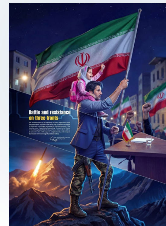
Direitos conforme a Seção 27A