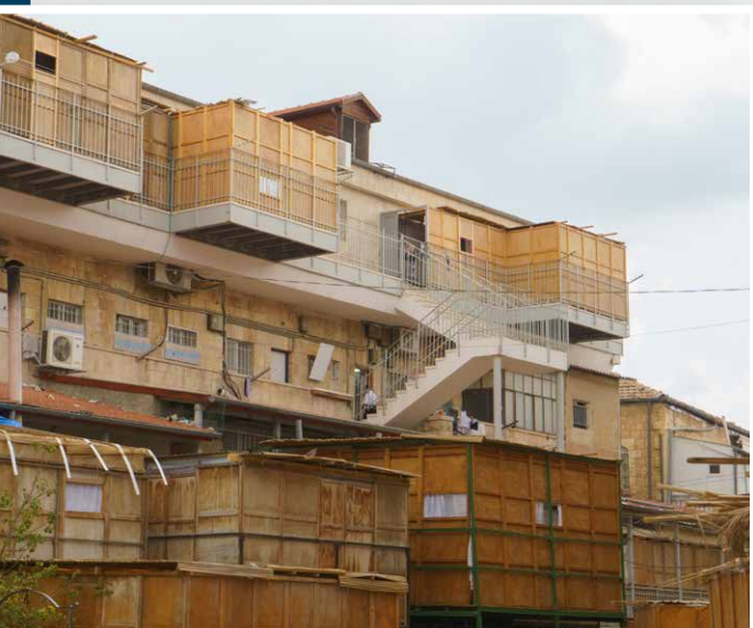
Sucás são construídas em sacadas, onde os homens desta comunidade religiosa irão morar por sete dias

Um dos eventos que tive que participar enquanto estava lá foi