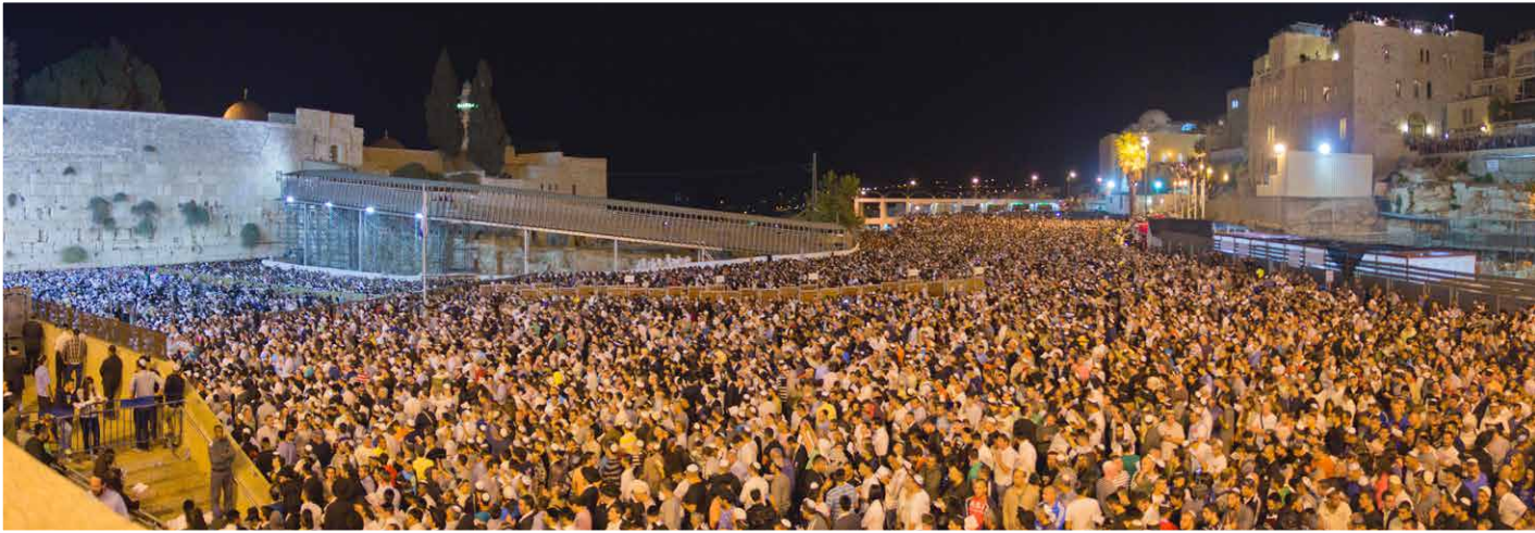
Autoridades estimam que 100.000 judeus foram ao Muro Ocidental para o “Slichot” (orações de perdão) na véspera do Yom Kippur

mado de Festa das Trombetas - nome apropriado porque as Festas de outono são a única vez que um shofar é tocado em Israel. Por dez dias após a Festa das Trombetas eu ouvia os toques do shofar, todas as manhãs, do meu apartamento em Jerusalém. Cada vez que isso acontecia, eu me sentia inspirada a orar pela nação de Israel enquanto ela se preparava para o Dia do Perdão. Para o povo judeu, esses 10 dias são chamados de “Dias de Temor” - dias de introspecção em que eles avaliam seus relacionamentos e se suas ações ofenderam ou feriram alguém durante o ano. Eu conseguia entender porque eles chamavam assim - eu mesma sentia a reverência. Eu nunca tinha ouvido falar de outra nação no mundo que dedicava 10 dias para refletir e examinar suas vidas, ações e relacionamentos.