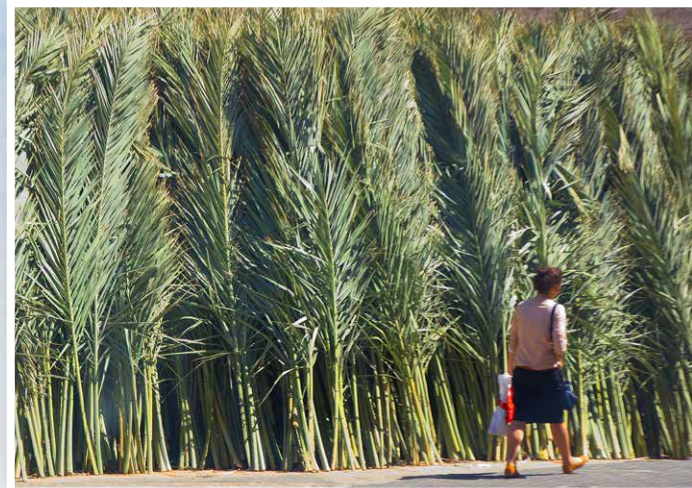
Pilhas de folhas de palmeiras colhidas para uso como “telhado” das sucás. O objetivo é ter uma cobertura onde ainda se possa ver as estrelas.

Hoje, olho para trás, para os meus primeiros dias no Google, “Como os cristãos celebram as festas”, e agradeço a Deus pelo presente que Ele me deu há muito tempo e que só agora comecei a desfrutar - o privilégio de celebrar as Festas. Elas são as Festas dEle e quando as celebramos, estamos celebrando-O, juntamente com Ele. Tenho certeza de que há muitos crentes como eu, que não entendem o valor dessas celebrações ou não percebem que elas são para os