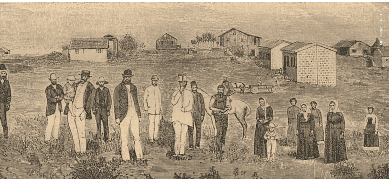
Ilustração representando Rishon Le’Zion em algum momento entre 1906-1913. Iniciada em 1882, esse assentamento quase entrou em colapso por causa dos resultados agrícolas ruins e fontes de água muito escassas. O filantropo judeu Barão James Rothschild veio em socorro, fornecendo técnicas agrícolas e poços de água.