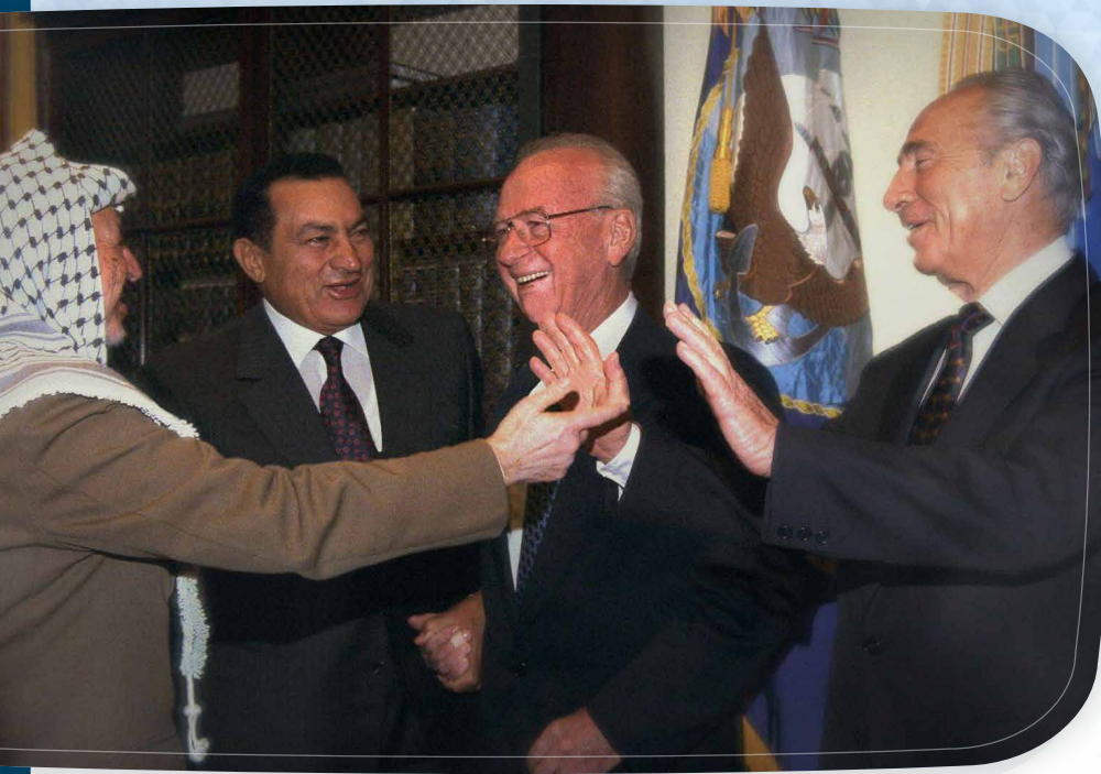
Da esquerda para a direita: O líder da OLP, Yasser Arafat; o presidente egípcio Hosni Mubarak, o primeiro ministro israelense Yitzhak Rabin e o Ministro do Exterior Shimon Peres