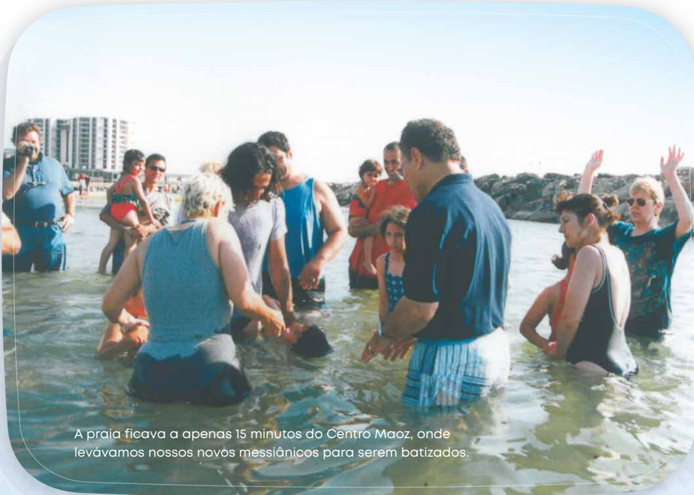
A praia ficava a apenas 15 minutos do Centro Maoz, onde levávamos nossos novos messiânicos para serem batizados.

Com nossa congregação com apenas uma semana de vida, fomos no sábado durante os Dez Dias de Temor, entre a Festa das Trombetas e Yom Kippur, o Dia da Expição 8 .